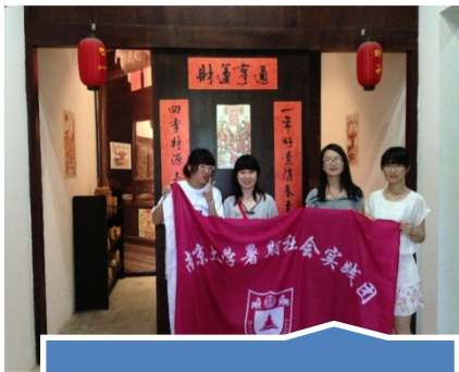
参观完年画展览馆与