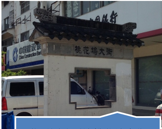
苏州团队到达桃花坞大街