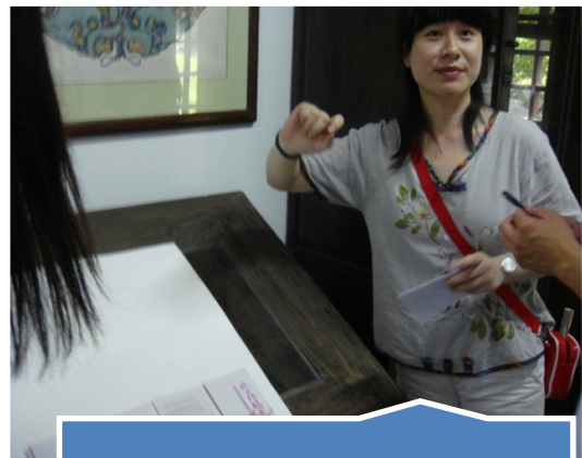
木版年画博物馆的姐姐们为