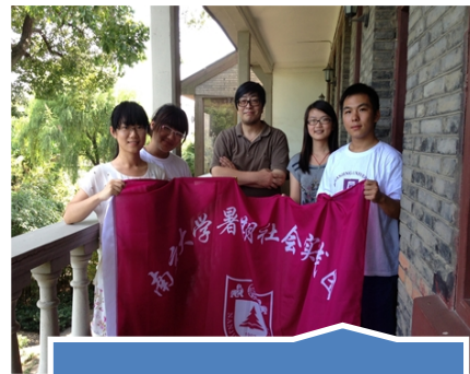
与博物馆馆长访谈结