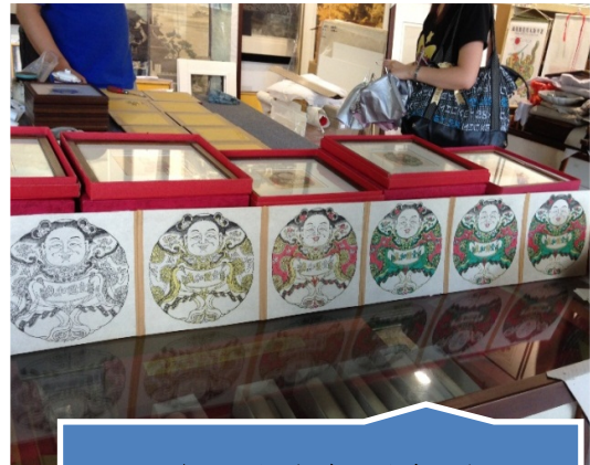
参观私人年画店面