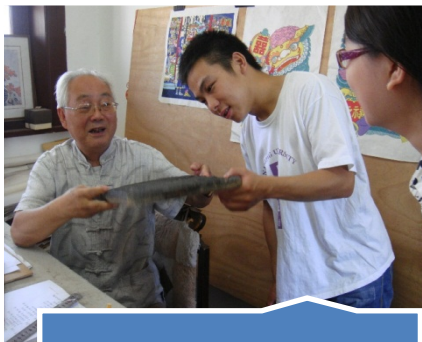
听王爷爷讲述年画的