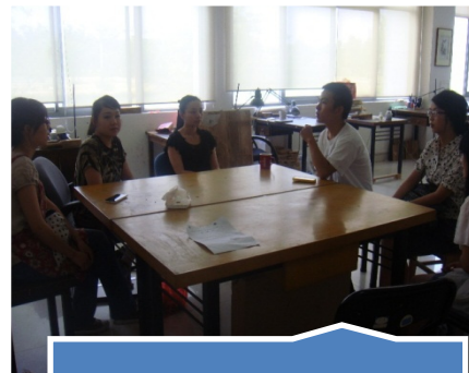
在工艺美院与年画社