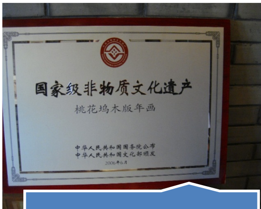
桃花坞年画是国家非物质文